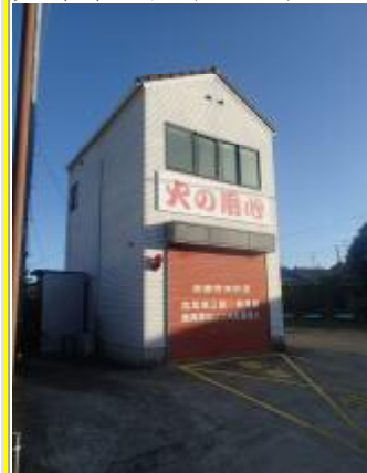
兵庫県淡路市の建物