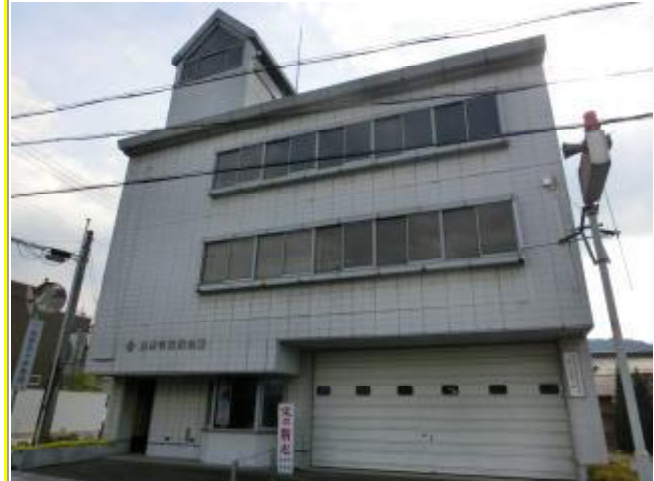
兵庫県丹波市柏原町の建物