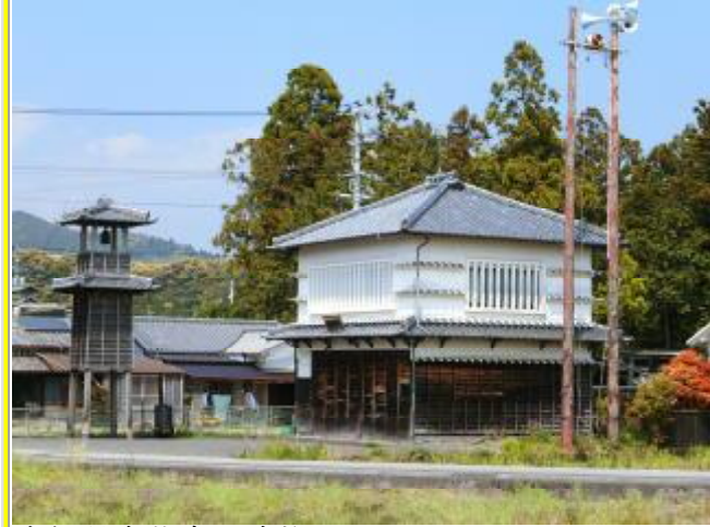
高知県安芸市の建物