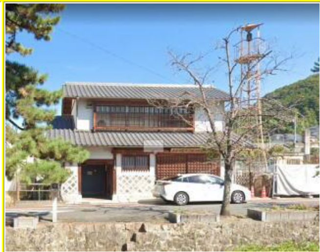
岡山県高梁市の建物