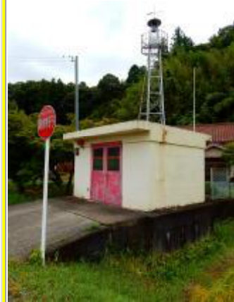
兵庫県三田市の建物