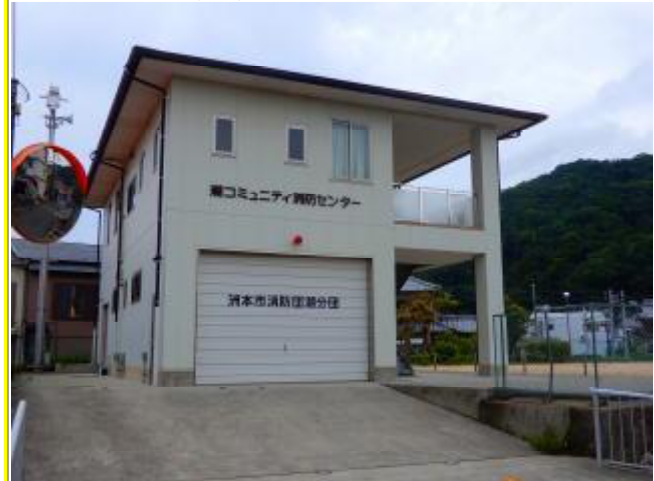
兵庫県洲本市の建物